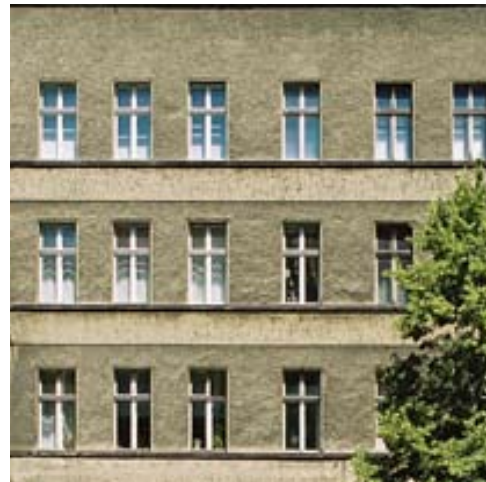
Objektzustand vor den Baumaßnahmen

IdealWert hat das gesamte Objekt 2006 in sehr kurzer Zeit außen und innen umfangreich saniert und erneuert. Dabei haben unsere Mitarbeiter sämtliche Arbeiten geplant, gesteuert, geprüft und abgerechnet. Im Rahmen der Baumaßnahmen haben wir unter anderem die Fassade sowie das Treppenhaus aufwendig saniert und die Holzkastendoppelfenster entweder instand gesetzt oder gegen moderne Isolierglasfenster ausgetauscht. Die sechs leer stehenden Wohnungen, die wir renoviert haben, statteten wir mit neuen Bädern und Küchen aus und setzten außerdem Wände und Fußböden instand. In neun von 13 Wohnungen bauten wir außerdem neue Heizungen ein.